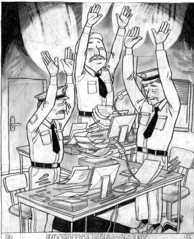
Marijpol aus: Transzendente Polizei

Spring #6 Verbrechen ISBN 978-3-9813037-3-5 168 Seiten, schwarz-weiß, farbiger Umschlag von Larissa Bertonasco