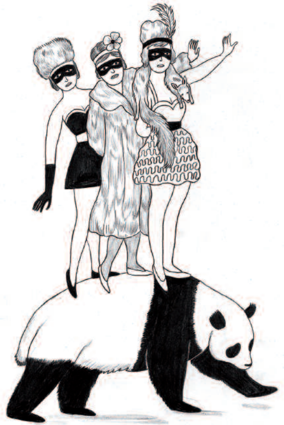
Carolin Löbber aus: The Circus of Crime